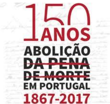
Carta de Abolição da Pena de Morte (2014)

A lista integra atualmente um total de 60 sítios.