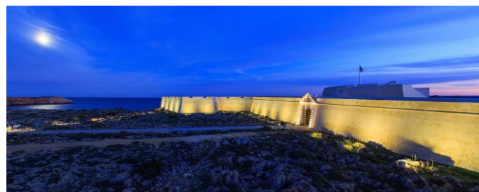
Promontório de Sagres (2015)