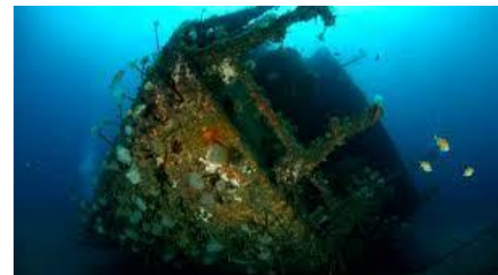
Património Cultural Subaquático dos Açores (2019)